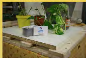
Les cartes sont enfin prêtes !