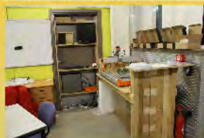
Nouveaux meubles et nouvelle machine