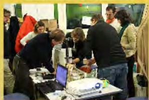
Le projet orthèse avance à l'aise