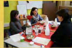
Plutôt dentifrice ou multi-usage ?