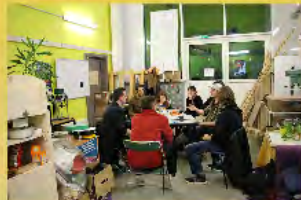
Le projet co-boutique pose ses idées